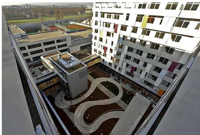
Teilansicht des neuen IKG Campus

Mit der Eröffnung des Maimonides-Zentrum, eines modernen Senioren- und Pflegeheims, am kommenden Dienstag ist der neue Campus der Israelitischen Kultusgemeinde (IKG) in der Wiener Leopoldstadt nun endgültig fertig. Der rund 28.000 Quadratmeter große Komplex wurde in dreijähriger Bauzeit um 93,5 Mio. Euro errichtet.