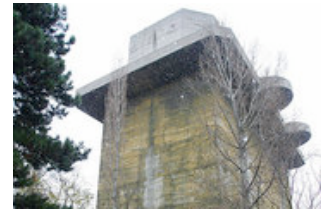
Der Flakturm im Augarten soll künftig Daten beherbergen

Trotz ihrer Geschichte: Nutzungsinteressenten für die mehr als 50 Meter hohen und zwei Meter dicken Betonkolosse finden sich immer wieder. Umbaupläne bestehen etwa für den Turm im Augarten und für jenen im Esterhazypark, in dem das Haus des Meeres untergebracht ist.