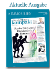
Kompakt als PDF herunterladen