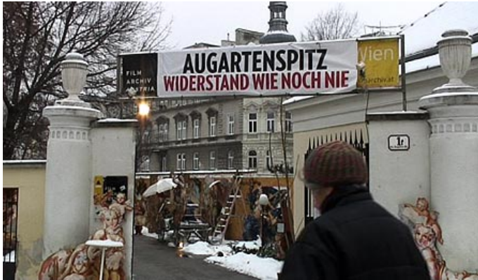
Besetzer Augartenspitz in Wien

Online gestellt: 22.01.2010 14:21 Uhr Aktualisiert: 22.01.2010 14:35 Uhr