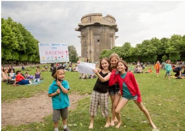
16 Fotos Protest-Picknick im Augarten

Im Augarten kam es am Mittwoch zu turbulenten Szenen: Hunderte Erholungssliebende und Kinder wurden von Parkwächern aus den Grünflächen vertrieben. Das sorgt für Aufregung und Proteste. Einen Tag später entschuldigte sich der private Sicherheitsdienst - allerdings nicht bei den verärgerten Parkbesuchern, sondern bei der Burghauptmannschaft!