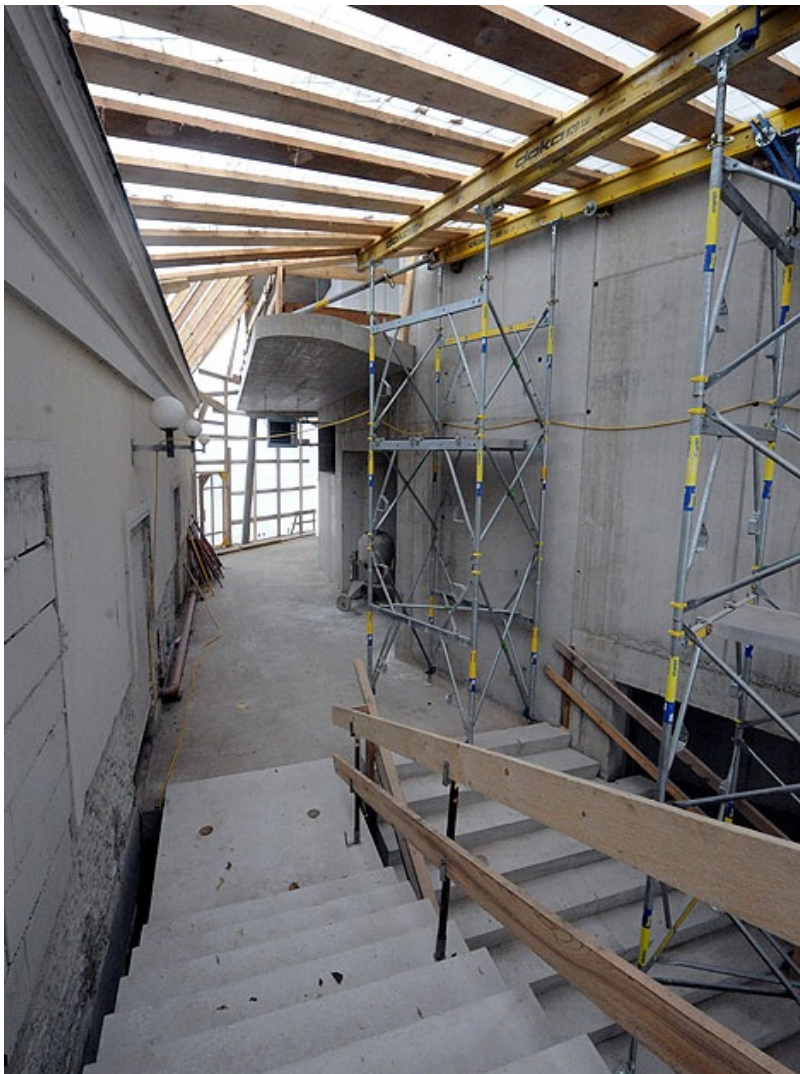
Im ehemaligen Pfortnerhaus wird unter anderem ein Cafe eingerichtet