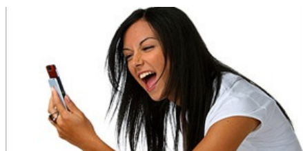
Dudelrecheck? Gammelfleischparty? Sprechen Sie die Sprache der Jugend?