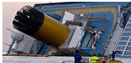
Costa Concordia Riskante Suche nach den Vermissten